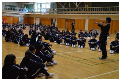
1年次グループ・エンカウンター