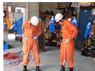
2年次インターンシップ